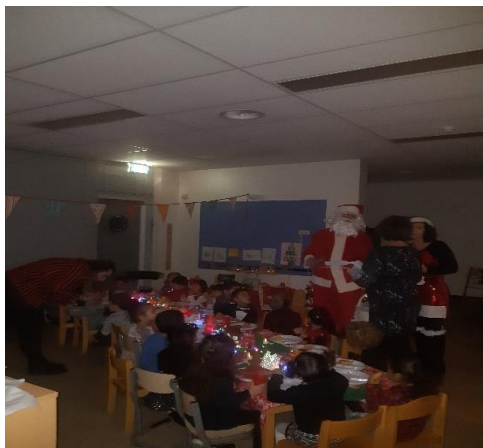
Kerstdinner met de Kerstman op bezoek

Wat hebben we een fijne avond gehad met elkaar. En wat zijn we verwend geweest door al dat lekkers waar de mama's en papa's hun best op hadden gedaan... dank!